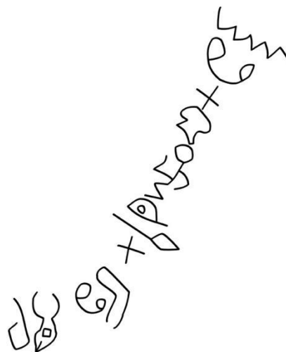
Натписи из Вади ел-Хола