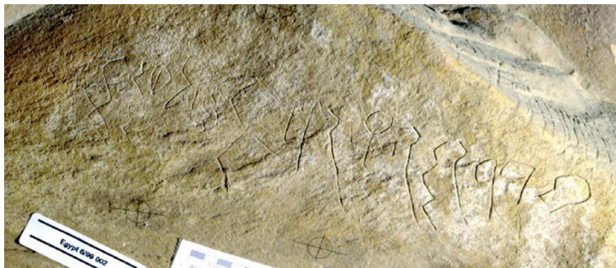
Wadi el-Hol Inscription 1. Drawing by Rollston

Постоје и два протосемитска натписа откривена 1998. године у Вади ел-Холу, урезана на каменим странама древног војног и трговачког пута између Тебе (данашњи Луксор) и Абидоса. Натписи се могу датирати у касно Средње краљевство (око 1850. године пре Христа). Знакови у њима графички су блиски онима са Синаја, али показују већи хијероглифски утицај. Сами натписи упућују на могући закључак да су прво алфабетско писмо створили азијски (семитски) плаћеници у египатској служби.