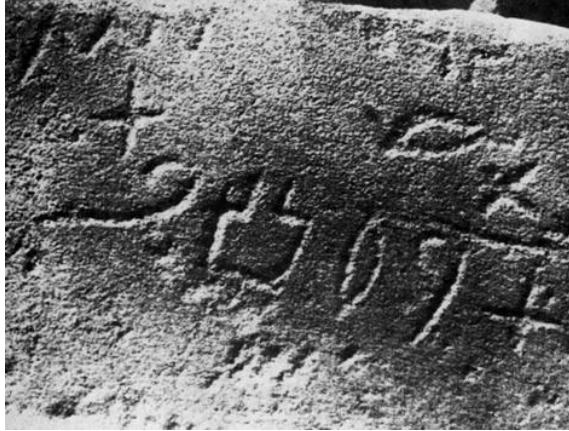
Serabit 246.Column 2. "Mt LB'lt" "Gift for Ba'alat"