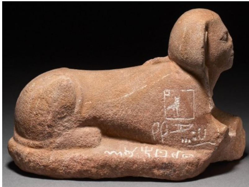
Сфинга Серабит ел-Кхадима

Порекло првог алфабетског писма још увек није са сигурношћу документовано. Већ је у антици изум алфабета приписиван Феничанима, од којих су га затим преузели Грци и остали народи. Овако су писали Херодот (5. век пре Христа) и Плиније Старији (1. век). Према Тациту (1-2. век), међутим, Феничани су били само посредници: Египћани су открили алфабет и пренели га Феничанима који су, затим, исти проследили Грцима. Имајући у виду тренутна сазнања, схватање модерне науке о пореклу алфабета није далеко од мишљења античких писаца. Од више локација које и даље претендују на то да буду места настанка најстаријег алфабета, можда се највише истичу две египатске: Синај и Вади ел-Хол.